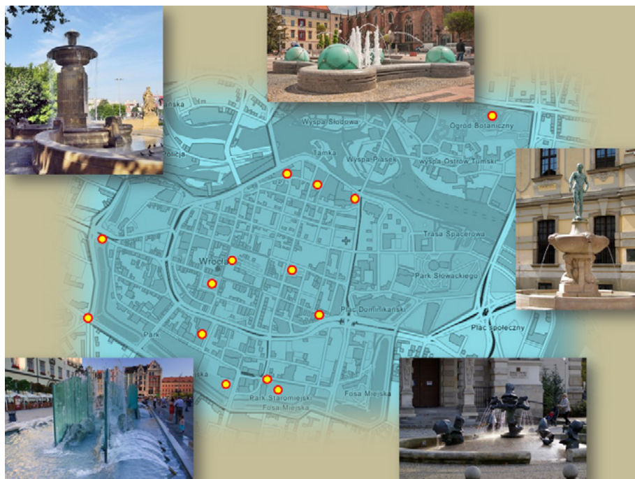
Ilustracja 2. Rozkład fontann w centrum miasta oraz wybrane przykłady ich ukształtowań architektonicznych

źródłem są rozliczne fontanny. W omawianym obszarze pod względem liczby stanowią one około połowy wszystkich fontann w mieście, a ich obecność ma istotny wpływ na pejzaż brzmieniowy miasta (zob. il. 2) 6 . W zależności od ich wielkości i konstrukcji emitują odmienne zjawiska brzmieniowe. Niekiedy są to zmienne barwowo szумы powstające na skutek nakładania się wielu strumieni wody, zróżnicowanych dodatkowo za pomocą różnego rozmiaru dysz. Czasem są to wręcz kaskady tafli spadającej wody objawiające się jako głośny plusk bądź trzask wody, a w innych przypadkach jednostajny, dość powolny ciek dający wrażenie delikatnego szumu.