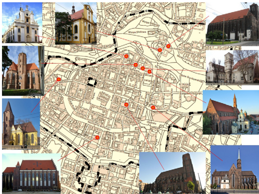
Ilustracja 4. Mapka poglądowa wrocławskich kościołów pozbawionych dźwięków dzwonów

Oprócz postulatów związanych z ekologicznym aspektem ochrony przestrzeni dźwiękowej centrum Wrocławia, zespół Pracowni zaproponował także by w uchwale pojawiły się zapisy dotyczące ochrony dźwiękowego dziedzictwa kulturowego 19 . Wyszły się tutaj dość istotne pod względem historycznym i kulturowym kwestie dbałości o obecność w przestrzeni centrum naturalnych brzmień dzwonów zegarowych i kościelnych, które coraz częściej zastępowane są dźwiękiem elektronicznym. Ponadto zwrócono uwagę, by przywrócić dzwony kościołom, które zostały pozbawione brzmienia tego instrumentu w ogóle. Aż dziesięć kościołów znajdujących się w obszarze Parku Kulturowego nie posiada dzwonów w skutek grabieży lub pożarów (zob. il. 4 20 ). W kilku zaś funkcjonują swoiste „atrapy” dźwiękowe w formie nagrań dzwonów emitowanych z głośników (np. Kościół św. Jakuba, Kościół Uniwersytecki).