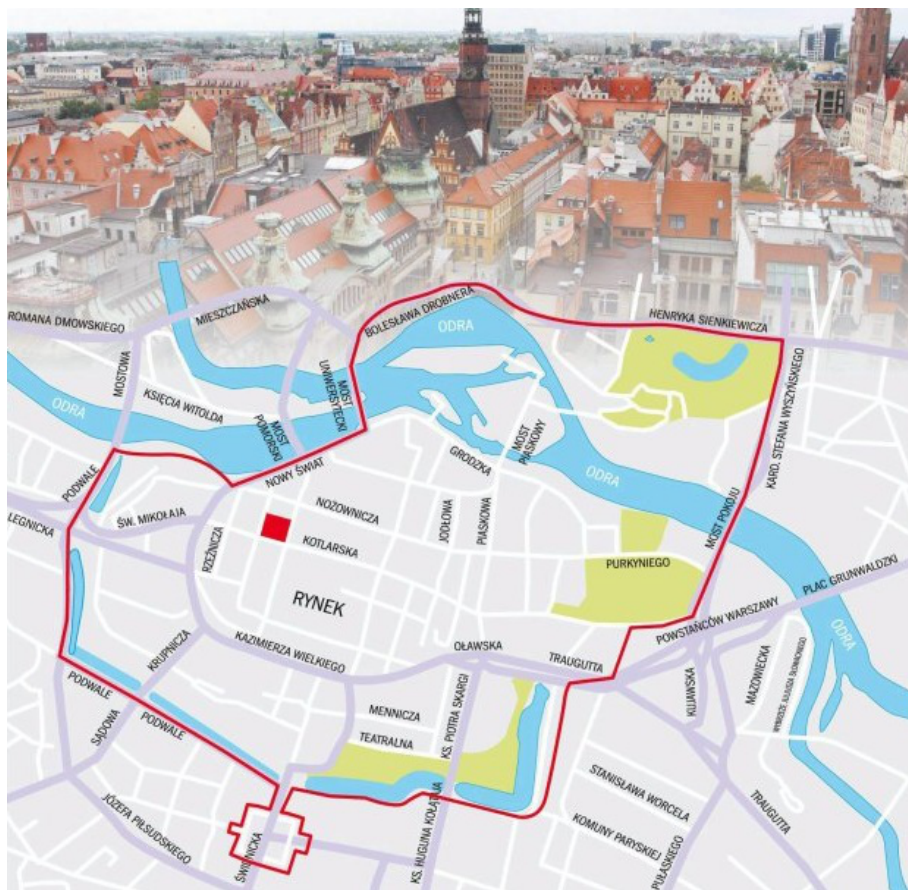
Ilustracja 3. Zakres terytorialny parku kulturowego 13

brzmią następująco: „Ilekcrc w uchwale jest mowa o: reklamie – nalezy przez to rozumieć powiadanie w jakiejkolwiek wizualnej lub dzwiekowej formie o towarach lub uslugach”.